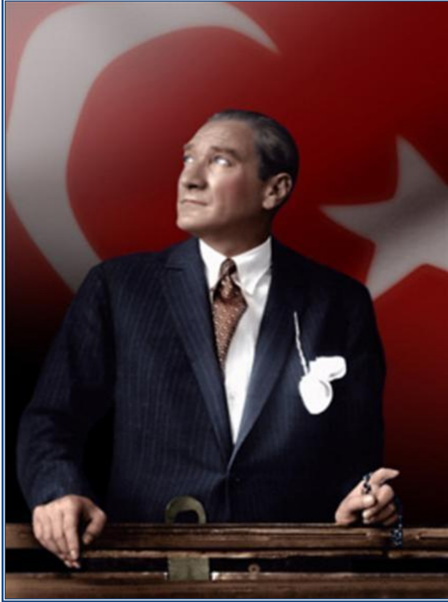
Mustafa Kemal ATATÖRK

“Çalışmadan, yorulmadan, üretmeden, rahat yaşamak isteyen toplumlar, önce haysiyetlerini, sonra hürriyetlerini ve daha sonrada istiklal ve istikballerini kaybederler”.